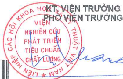
TS. Ngô Tất Thắng